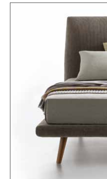
Piede in noce canaletto Canaletto walnut feet