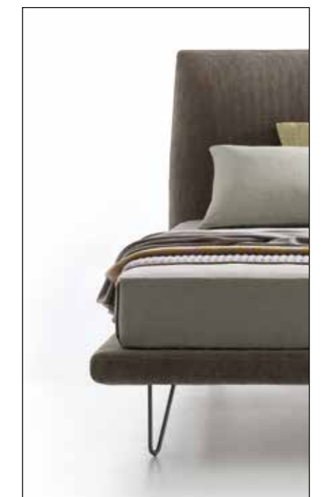
Piede in metallo Metal feet